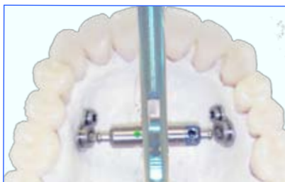
Activation du Distracteur Sourire Uniforme