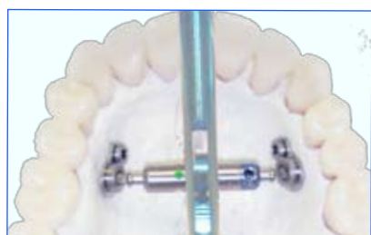
Activatie van de Smile Distractor