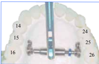
Activatie van de Smile Distractor