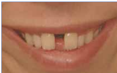
DISTRACTOR IN ACTIE

Reinig de distractor dagelijks met een zachte kinder- tandenborstel.